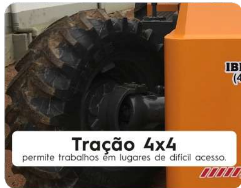
Tração 4x4 permite trabalhos em lugares de difícil acesso.