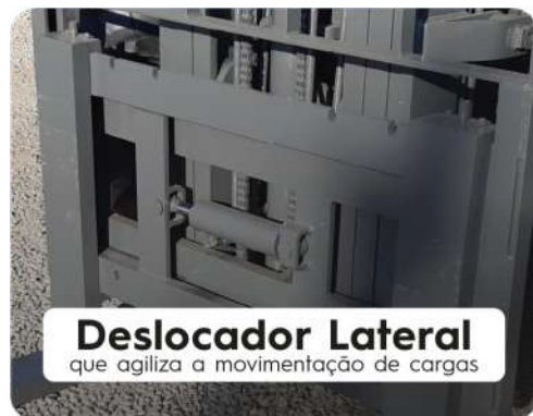
Deslocador Lateral que agiliza a movimentação de cargas