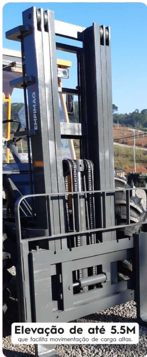
Elevação de até 5.5M que facilita movimentação de carga altas.