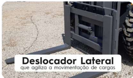
Deslocador Lateral que agiliza a movimentação de cargas