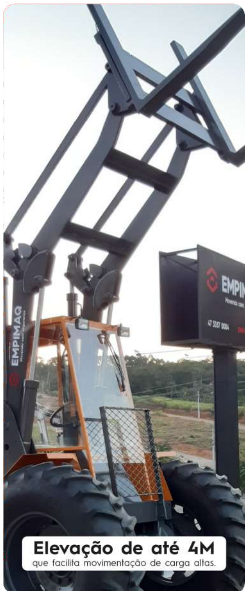
Elevação de até 4M que facilita movimentação de carga altas.