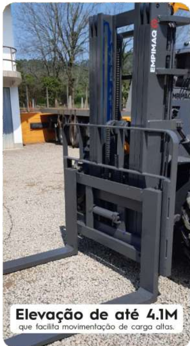
Elevação de até 4,1M que facilita movimentação de carga altas.