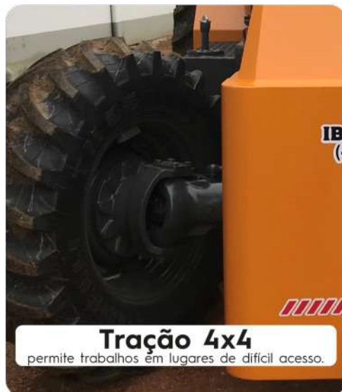
Tração 4x4 permite trabalhos em lugares de difícil acesso.