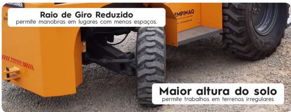
Raio de Giro Reduzido permite manobras em lugares com menos espaços.