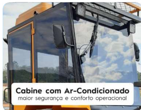
Cabine com Ar-Condicionado maior segurança e conforto operacional