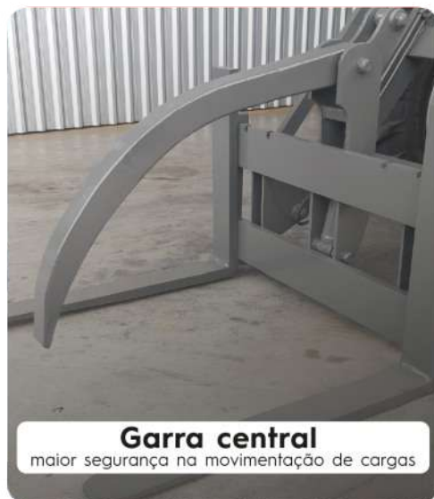
Garra central maior segurança na movimentação de cargas