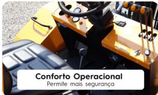
Conforto Operacional Permite mais segurança